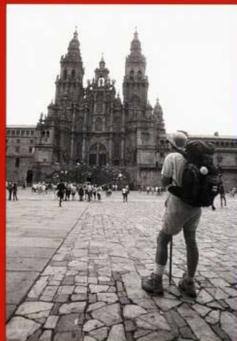
All'arrivo a Santiago, il pellegrino può ottenere la Compostela (qui sotto), cioè il certificato dell'avvenuto pellegrinaggio, dopo aver mostrato la sua credencial su cui sono stati posti i timbri degli ostelli dove ha pernottato.

Questa moderna pergamena viene rilasciata ai pedoni che abbiano camminato almeno 100 chilometri fino a Santiago o ai ciclisti che abbiano percorso almeno gli ultimi 200 e, negli uffici dell'Arcivescovado, un fantastico librone riporta la traduzione più appropriata dei nomi da qualunque idioma possibile al latino, lingua in cui la Compostela è redatta. E le nazionalità dei viaggiatori non sono certo poche, oggi come in passato. "A questo luogo vengano i popoli barbari e coloro che abitano in tutti i climi della terra" sta scritto nel duecentesco Liber