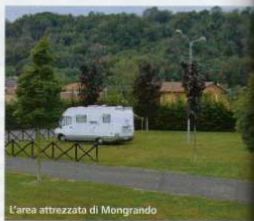
L'area attrezzata di Mongrando

8352331, www.cercatoridoro.it . Centro Ippico San Giorgio, Cascina Pianone, Cerrione, tel. 015 677156, www.ippicasan giorgio.it .