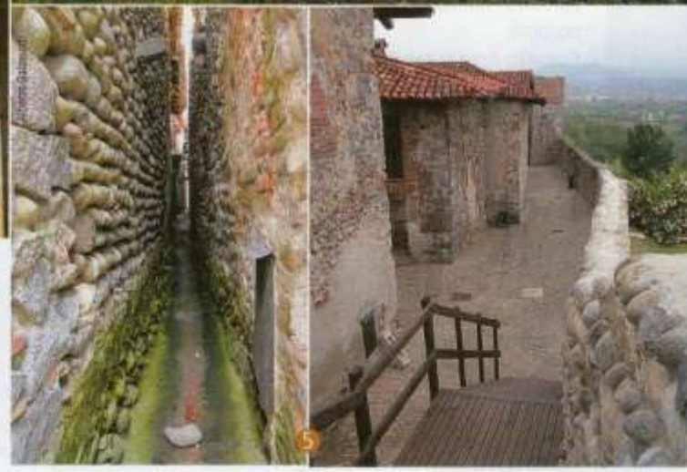
1 Il borgo di Rosazza deve il nome a Federico Rosazza, esponente della massoneria biellese che nell'800 lo ricostruì arricchendolo di numerosi elementi esoterici. 2 L'attuale edificio del Santuario di Oropa, databile fra il XVII e il XVIII secolo. 3 Il Santuario di San Giovanni d'Andorno si erge nella Valle del Cervo a oltre 1.000 metri di altitudine. 4 Le industrie Zegna sorgono a Trivero, paese natale del fondatore Ermenegildo. 5 Le mura perimetrali e un angusto vicolo del borgo medioevale di Candelo.

tra a cinque piani costruito nei boschi a 1.000 metri di quota e con una strana storia alle spalle. Di proprietà degli Ambrosetti, famiglia di industriali della lana, rappresenta dal XVIII secolo un vero enigma: cosa voleva farne il proprietario? Una fabbrica, una cascina, un edificio religioso? Risulta infatti un po' sovradimensionato rispetto al luogo in cui si trova. Per breve tempo venne utilizzato dai frati trappisti a cui deve il nome, mentre oggi, parzialmente restaurato, fa parte della Rete Museale del Biellese e funziona come una sorta di rifugio offrendo pasti e posti letto.