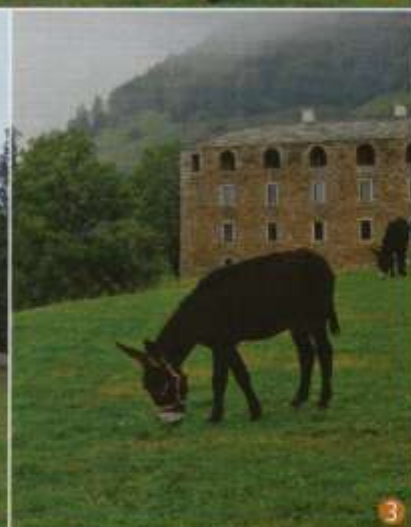
1 Il complesso rurale del Centro Ippico San Giorgio di Cerrione, ai margini del Parco Regionale La Bessa. 2 La chiesa romanica di San Secondo Magno, a Magnano, risale all'XI secolo. 3 La Trappa di Sordevoles deve il suo nome ai monaci trappisti che vi abitarono alla fine del '700. 4 Un'amena veduta di Castel Roppolo, con il Lago di Viverone sullo sfondo. 5-6 Il Piazza, la zona alta di Biella, sede di prestigiosi palazzi nobiliari, e un panorama della città con i lanifici tuttora in attività.

Non solo storici Sono innumerevoli i personaggi originali del Biellese famosi per i più disparati motivi. Ne citiamo solo alcuni in ordine volutamente casuale, consapevoli di tralasciarne altri. Amedeo Avogadro, chimico e fisico legato all'omonima legge sui gas perfetti. I quattro fratelli La Marmora: Alberto, Alessandro (fondatore del corpo dei Bersaglieri), Alfonso e Carlo Emanuele, tutti generali e ministri durante il Risorgimento. Pietro Micca, eroe dell'Assedio di Torino del 1706, nativo di Sagliano Micca. Quintino Sella (nella foto), ministro delle finanze con Vittorio Amedeo II e fondatore del CAI e il nipote Vittorio Sella,